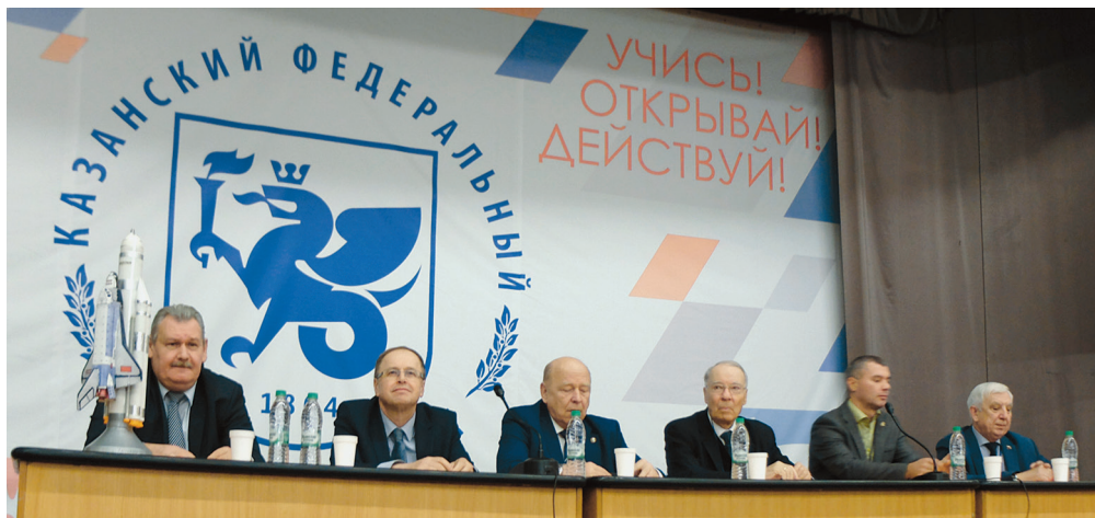
Президиум Школы-конференции «Космическая наука»

в ближайшие сто лет ни один из них не упадет на Землю.