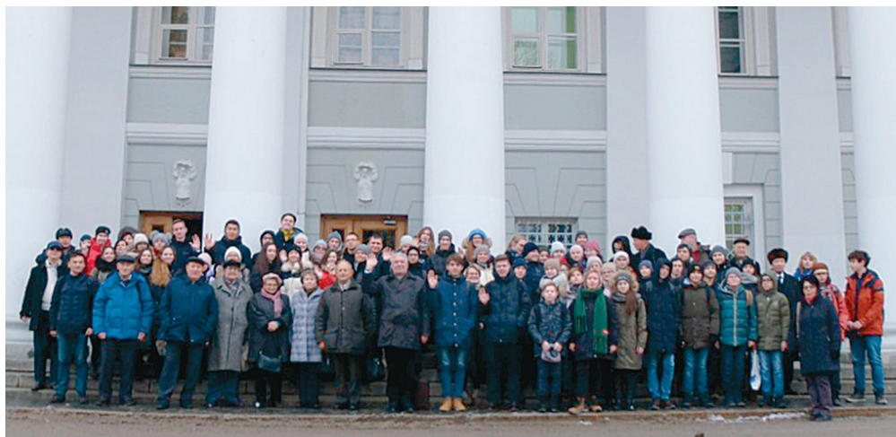
Участники Молодежной школы-конференции “Космическая наука” перед главным зданием Казанского федерального университета

В 1938 году был выяснен и основной компонент этого вещества: обнаружение межзвездных линий излучения продемонстрировало, что газ, заполняющий пространство галактического диска, представляет собой, главным образом, водород. Несколько раньше, в 1930 г., американский астроном швейцарского происхождения Роберт Трамплер продемонстрировал, что, помимо межзвездного газа, существует также и межзвездная пыль. Однако полномасштабные исследования межзвездного вещества начались только в конце 1940-х гг., когда у астрономов появилась возможность проводить наблюдения в радиодиапазоне. По современным представлениям, межзвездное вещество состоит из смеси газа и пыли, причем масса пыли уступает массе газа в 100 раз. Примерно половина объема галактического диска заполнена очень горячим корональным газом с температурой около миллиона градусов и концентрацией около 0,005 \text{ см}^{-3} . Другая половина объема диска занята “теплой фазой”: частично ионизованным газом с температурой около 10 000 К и концентрацией 0,5 \text{ см}^{-3} .