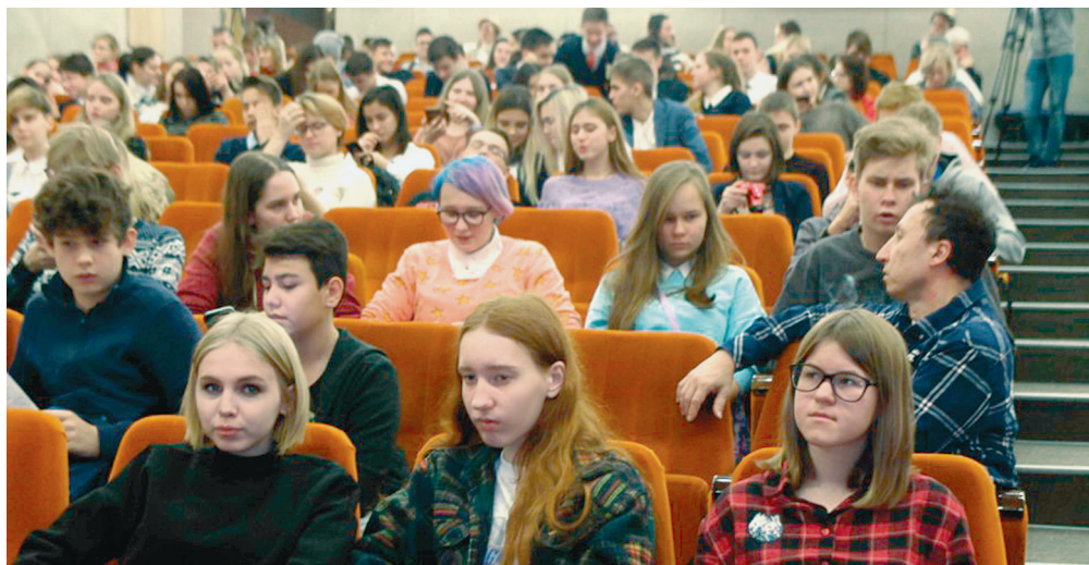
Школьники на конференции

на другие планетные системы?” – был посвящен новейшим открытиям экзопланет и связанных с ними вопросам к общепринятой теории их образования. Открытые у других звезд планетные системы оказались совершенно непохожими на нашу, и теперь необходим пересмотр общепринятой теории планетной космогонии. Докладчик рассказал о своей гипотезе, согласно которой быстрое вращение протопланетного облака могло привести к долгому накоплению вещества в формирующейся звезде, а за это время в газопылевом диске успели сформироваться все планеты. Во время своего роста эти планеты могли захватывать вещество от растущей протозвезды и превращаться в планеты-гиганты рядом с родительской звездой. Во втором докладе – “Планы России в изучении Солнечной системы космическими средствами и упущенные возможности” – А.В. Багров проанализировал положение в этой области отечественной космонавтики. Россия достигла огромных успехов в пилотируемой космонавтике и разработке систем для длительного пребывания людей на орбитальных